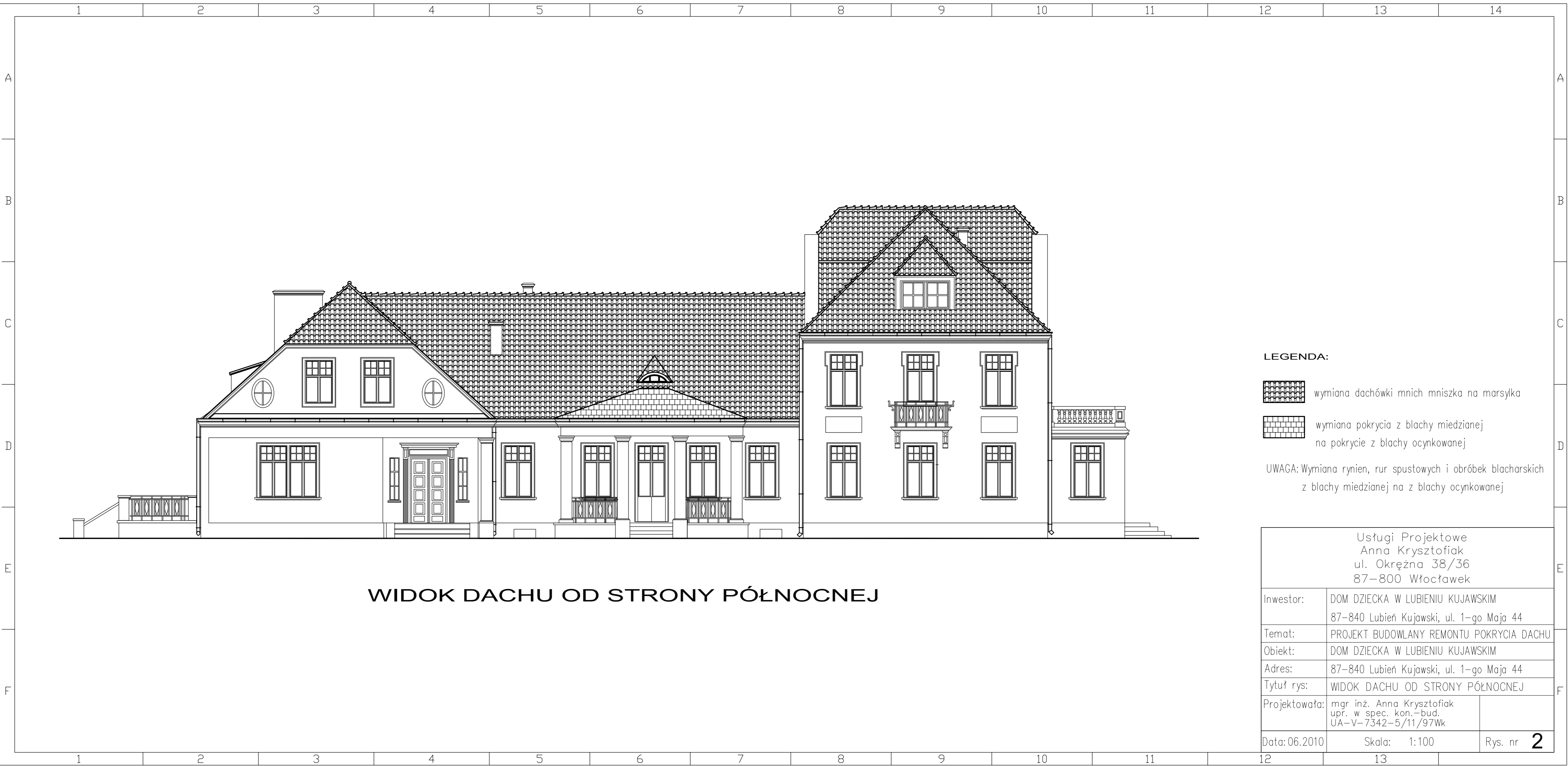
WIDOK DACHU OD STRONY PÓLNOOCNEJ