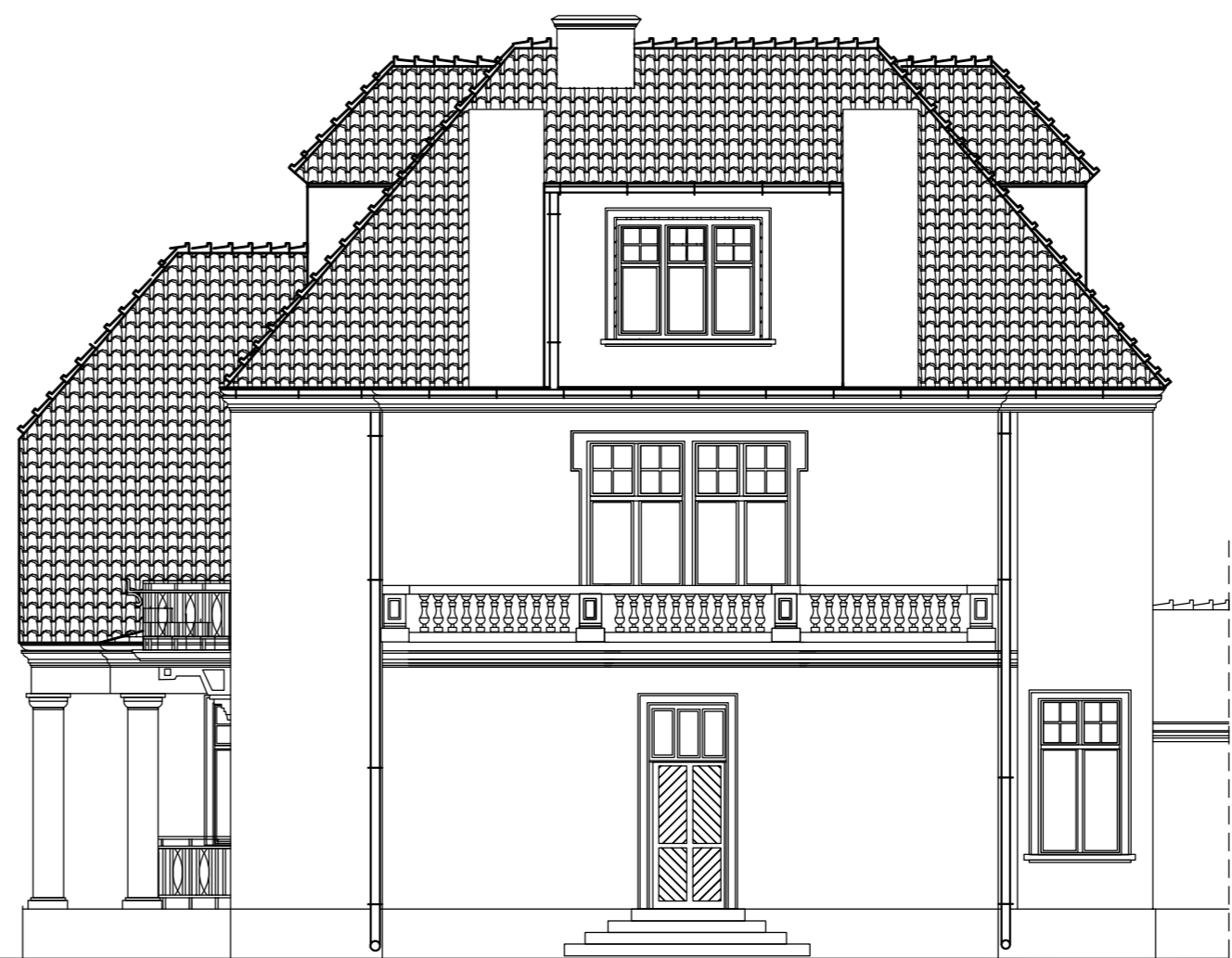
WIDOK DACHU OD STRONY ZACHODNIEJ