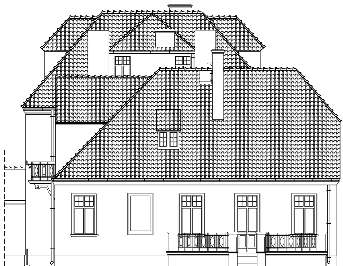
WIDOK DACHU OD STRONY WSCHODNIEJ