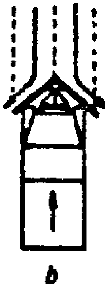
a - plugiem jednostronnym,