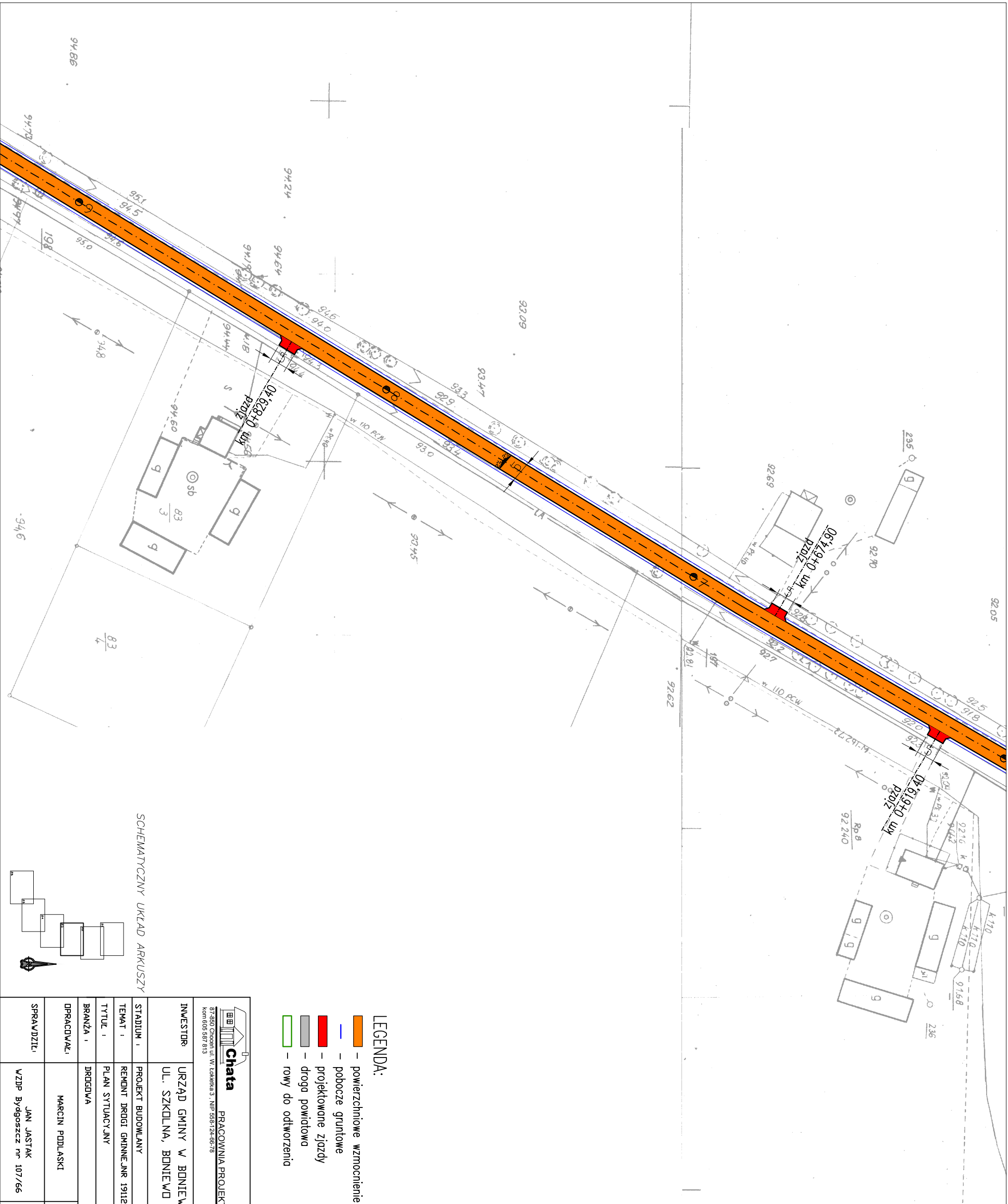
SCHEMATYCZNY UKŁAD ARKUSZY